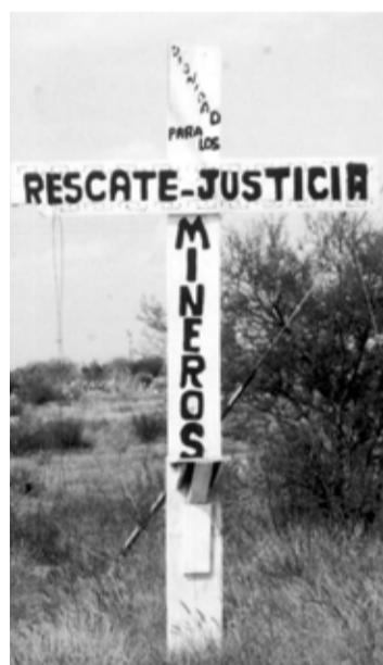
Obra. Pasta de Conchos fue uno de los temas de su trabajo.