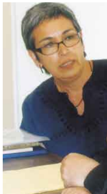
Creadora. La artista ha expuesto su obra en distintas ciudades de España.